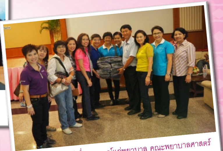
การอบรมให้ความรู้เรื่องสหกรณ์แก่พยาบาล คณะพยาบาลศาสตร์ มหาวิทยาลัยนวมินทราธิราช วันที่ 17 พฤษภาคม 2557 ณ โรงแรมนิวทราเวล บีช รีสอร์ท จังหวัดจันทบุรี