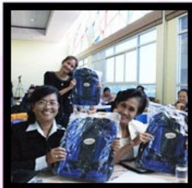
การอบรมให้ความรู้เรื่องสหกรณ์แก่บุคคลทั่วไป ในงานประชุมวิชาการสมาคมศิษย์เก่าเกื้อการุณย์ ณ คณะพยาบาลศาสตร์เกื้อการุณย์ วันที่ 21 พฤษภาคม 2557