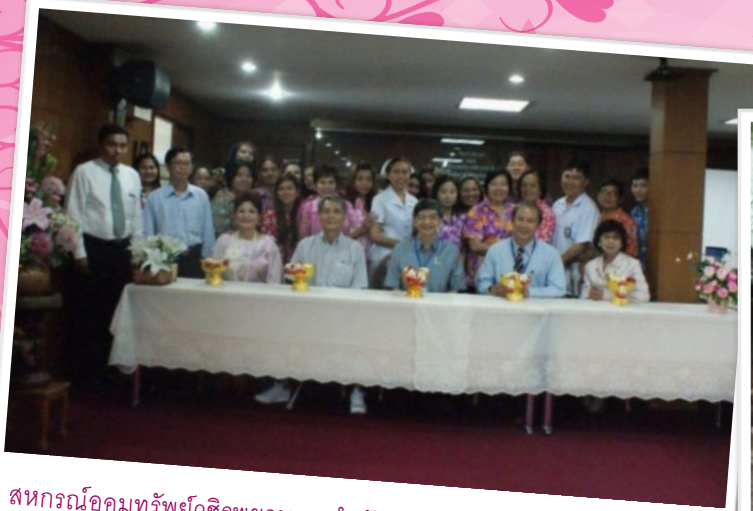
สหกรณ์ออมทรัพย์วชิรพยาบาล จำกัด จัดกิจกรรมเนื่องในวันสงกรานต์ เมื่อวันที่ 8 เมษายน 2557 ณ ห้องประชุมนายแพทย์ประเสริฐ นุตกุล

ปีที่ 12 ฉบับที่ 80 ประจำเดือน เมษายน - พฤษภาคม 2557