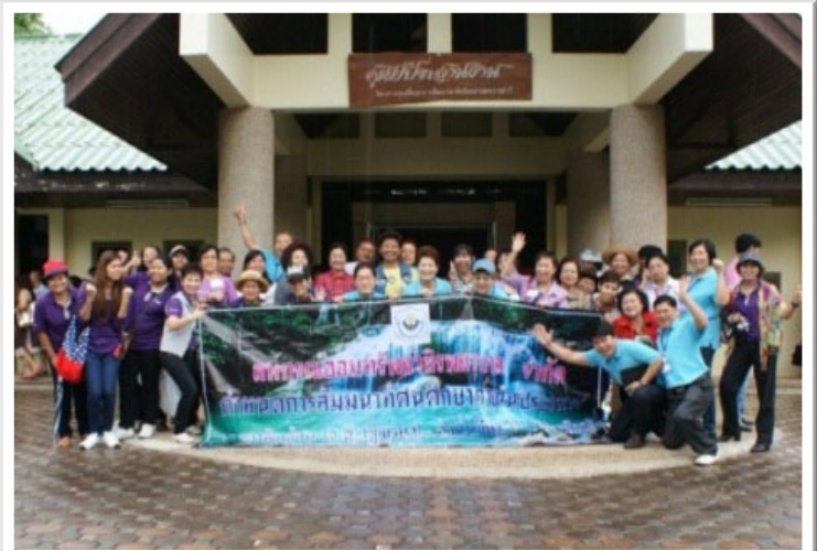
การสัมมนาและทัศนศึกษาภายในประเทศ ระหว่างวันที่ 10 - 11 พฤษภาคม 2557 ณ เขาหินซ้อน (จ.ฉะเชิงเทรา) - วังน้ำเขียว (จ.นครราชสีมา)