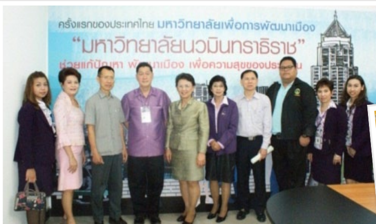
การอบรมให้ความรู้สหกรณ์แก่พนักงานมหาวิทยาลัย ในสังกัดสำนักอธิการบดี มหาวิทยาลัยนวมินทราธิราช เมื่อวันที่ 1 เมษายน 2557